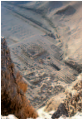
Deir el Bahari: temple de Montouhotep II

En Égypte même, la réforme des institutions centrales et provinciales visait à adapter l'ancienne principauté thébaine à un état rayonnant désormais sur un territoire beaucoup plus vaste. Dans les provinces, l'état thébain a été relayé en quelques points stratégiques par de grands personnages, dont certains étaient déjà en poste avant la "conquête". Le roi a ainsi privilégié la continuité administrative plutôt que la rupture. La ville d'Hermopolis semble en particulier avoir constitué le pivot sur lequel s'est appuyé le contrôle royal sur la Moyenne Égypte, et peut-être au-delà. Les travaux menés récemment dans la nécropole d'El-Bercha ont complètement renouvelé notre approche de la question et laissent entrevoir des perspectives prometteuses mais à confirmer.