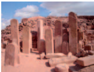
Serabit al-Khadim (Sinai)

Voyage en Egypte en 2011 - Résultats de l'enquête