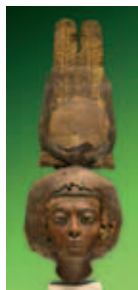
La reine Tiye