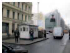
Check point Charlie