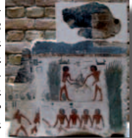
Chasse dans les marais

dans ce Neues Museum que nous visitons, qu'en octobre 2009 ; l'aménagement n'en est d'ailleurs pas tout à fait terminé. Il est prévu qu'une "promenade archéologique" fasse le lien entre 4 musées, qui se visiteront alors sans passer à l'extérieur; en attendant nous faisons le tour pour visiter le musée de Pergame, aux monuments impressionnants par leur taille et leur parfait état de conservation: autel de Pergame, porte de Millet et tout particulièrement la porte d'Ishtar de Babylone, aux couleurs éclatantes.