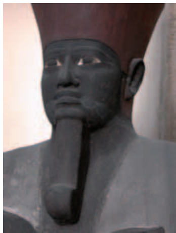
Montouhotep II - Musée du Caire

Compte rendu de la conférence de L. Postel du 18 mai 2010