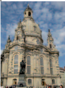
Dresde: la Frauenkirche

centre ville sont somptueux : le palais Zwinger, le Semperoper, la Hofkirche ... Les collections d'art, constituées par le prince électeur Auguste le fort, sont également remarquables : nous visitons la "voûte verte", collection de pièces de joaillerie et orfèvrerie, qui démontre la virtuosité des artistes de l'époque .