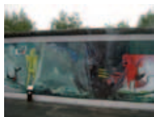
Berlin: les restes du mur