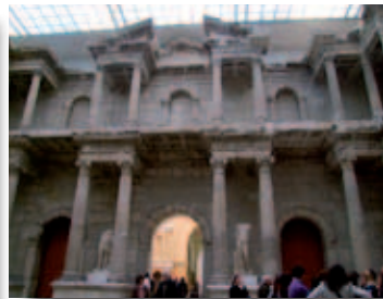
La porte du marché de Millet