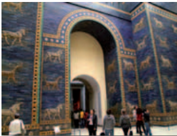
La porte d'Ishtar