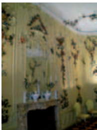
Sans souci: une chambre