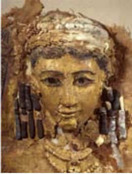
Couvercle de momie (Douch - Oasis de Kharga - 2 e s. ap.J.C.) Restauration Annie Schweitzer