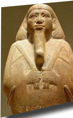
Oushebti de Taharqa (Pyramide 1 de Nuri)