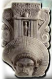
Chapiteau hathorique - Musée de Limassol

Conférence de M. Thierry Petit le 18 novembre 2008.