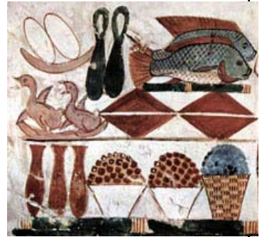
Offrandes alimentaires - Tombe de Menna, scribe des domaines du seigneur des deux terres - 18 e dyn. - (TT69).

En première partie, Isabelle Lesueur, documentaliste mise à disposition par le pôle d'archéologie interdépartemental rhénan de Sélestat, tiendra une conférence pour nous mettre en bonne condition avant de passer à table, à partir de textes et d'iconographie très peu connus.