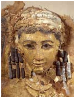
Couvercle de momie (Douch - Oasis de Kharga - 2 e s. ap.J.C.) Restauration Annie Schweitzer