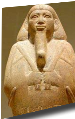
Oushebti de Taharqa (Pyramide 1 de Nuri)