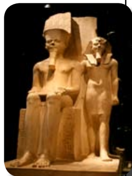
Amon et le roi (18 e dyn.)