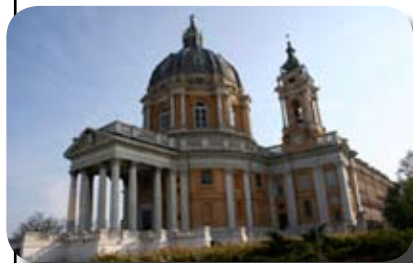
La basilique de Superga

Le matin, nous visitons la basilique baroque de Superga qui domine Turin. Sous le sanctuaire s'étend un vaste mausolée abritant princes et ducs de Savoie ainsi que des rois de Sardaigne. En redescendant on peut admirer les rives du Pô avec ses petits ponts et ses parcs.