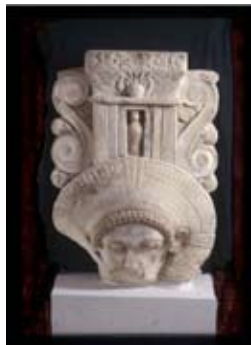
Pilier hathorique Musée de Limassol

Les conférences ont lieu à 18h 45 à la maison des associations, 1a, place des orphelins à Strasbourg. Ouverture des portes à 18h 15. Entrées: non adhérents 6€ - Etudiants non adhérents 3€ - Tous adhérents 2€