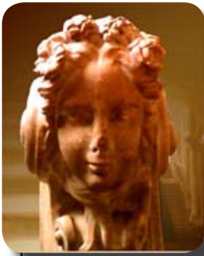
Palais Madame - Détail

L'après-midi, nous découvrons avec notre guide le palais Madame dans le cœur historique de la ville, ancien château médiéval bâti sur l'enceinte romaine et sur lequel on adapta une façade baroque au 18 ème siècle. Sur plusieurs étages, ce musée abrite de très riches collections couvrant 2000 ans d'histoire de la ville. La fin d'après-midi, libre, a permis à chacun, soit d'apprécier l'atmosphère de fête de la ville, soit de revoir certains monuments.