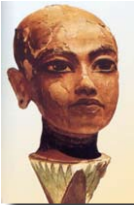
Tête de Toutânkhamon enfant - Musée du Caire

Du mobilier funéraire de Toutânkhamon se détache une œuvre délicate, trouvée à l'entrée de la tombe. Réalisée en bois stucqué et peint, aujourd'hui traversée d'une fissure verticale à la tempe gauche, elle représente une tête enfantine, au crâne glabre allongé selon le style amarnien, aux oreilles percées, le cou émergeant de la corolle évasée d'un lotus. Toutânkhamon jaillit ainsi en jeune soleil du grand lotus primordial.