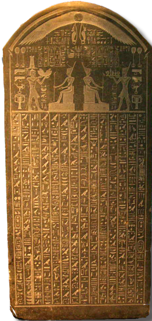
Stèle de Nectanebo 1 er (380 - 362), copie de la stèle de Naucratis, trouvée dans les eaux d'Aboukir (granit - Musée d'Alexandrie).