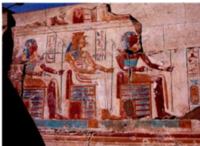
Temple de Millions d'Années de Ramsès II (Abydos)

• Le temple de Millions d'Années de Ramsès II à Abydos (I) , plus petit et plus détruit que son célèbre voisin, mais dont le décor est suffisamment préservé pour restituer la destination de chaque pièce et, partant, le fonctionnement de l'ensemble.